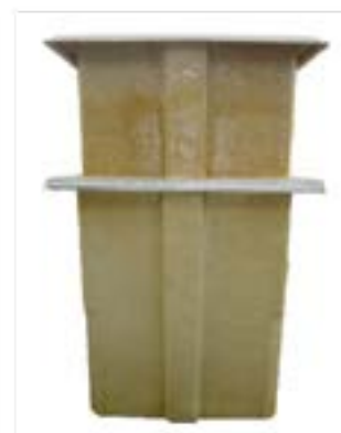
Regard T17 avec rehausse h 300