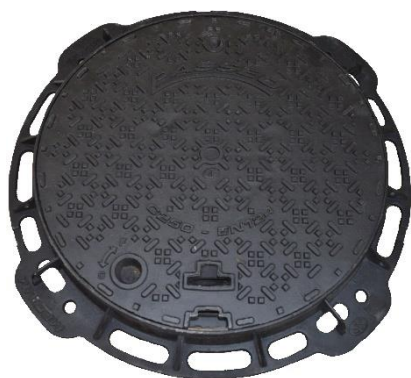
Cadre et couvercle fonte C250