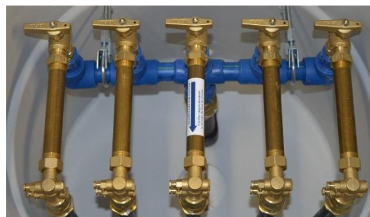
ISO CYL 600 pour 5 compteurs DN15 lg 170 mm

Garantie hors gel réalisée par le CEBTP Equipements intérieurs certifiés ACS et conformes à la norme NF