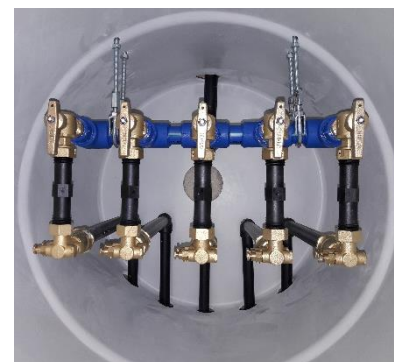
ISO CYL 600 5 DN15 1 Entrée 40 – 5 Sorties 25